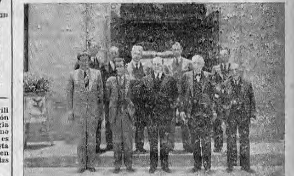
Asistentes a la reunión que ayer tuvo lugar en la secretaría de relaciones para continuar cambiando impresiones sobre el proyecto para construir el edificio donde se instalará las oficinas de la corte, archivos nacionales, registro público, reunión a la cual nos referimos ampliamente en la presente edición.